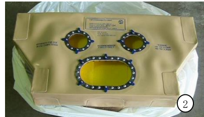
スーパー耐久 ②: ST4クラス DC5

①: VEMAC用 FUEL CELL 100L (VEMAC・LEGACY B4・PORSCHE 複数台)