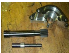
切削加工+熱処理 (STARTER PARTS)