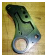
切削加工品 (VEMACロッカーアーム)