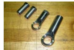
MATERIAL SCM435 BRG CASE