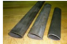
MATERIAL 4130 STEEL