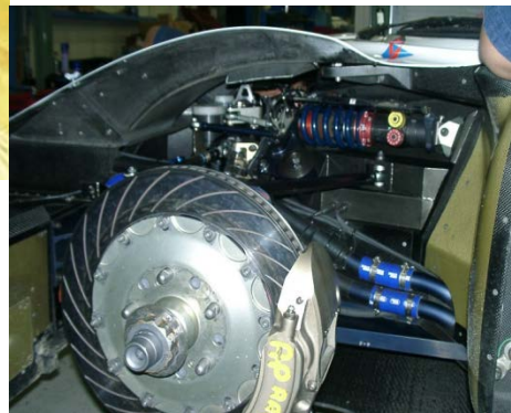
(VEMAC Front SUSPENTION COMP)