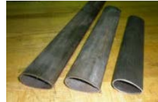
MATERIAL 4130 STEEL