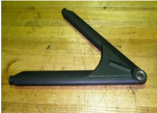
(VEMAC Front ARM. COMP)