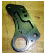
切削加工品 (VEMACロッカーアーム)