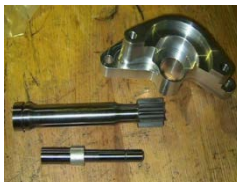
切削加工+熱処理 (STARTER PARTS)