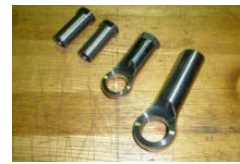
MATERIAL SCM435 BRG CASE